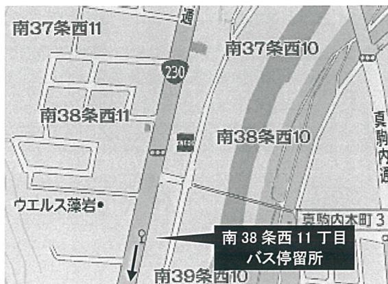
◆【南 38 条西 11 丁目 停留所(石山通)】