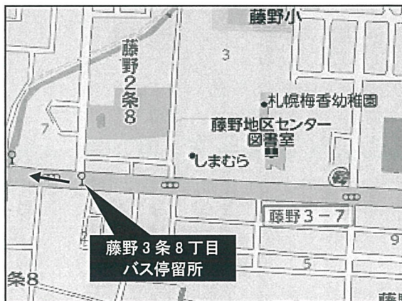
◆【藤野 3 条 8 丁目 停留所(石山通)】